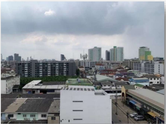
ด้านซ้าย